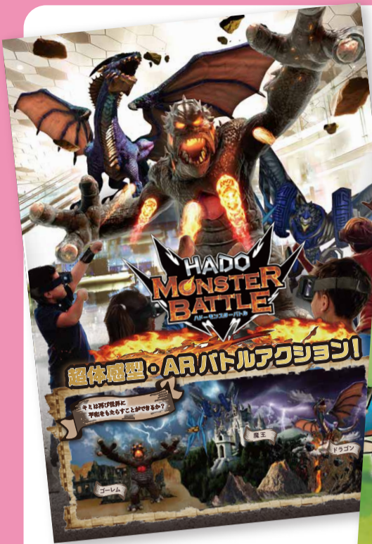
人気コンテンツの「HADOモンスターバトル」と「HADOシュート」を体験出来ます